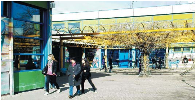
Die Gesamtschule Espenstraße bekommt den sechsten Zug

nungssicherheit.", betonen Monika Schuster und SPD-Ratsherr Ulrich Elsen, Vorsitzender des Schulausschusses. Nun können die Weichen für die notwendigen Investitionen im Schulgebäude am Bäumchesweg bereitgestellt werden. Immerhin werden rund 465.000 Euro für Modernisierungen ausgegeben. Monika Schuster: "Erfreulich ist, dass die Gesamtschule Neuwerk zur Erweiterung des Gesamtschulangebots eine weitere Klasse als "Überlast" einrichtet. "Überlast" bedeutet, dass diese Klasse nur für das kommende Schuljahr eingerichtet wird. "Wir wollen